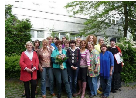
Seminar Teilnehmerinnen in Hamburg 2010

Sie sind auch Pioniere und Pionierinnen, die innerhalb ihres Senioren-Assistenten-Netzwerks das neue Berufsbild in der Gesellschaft etablieren wollen.